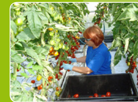
Récolte des tomates

Le succès de GSPP repose sur l'implication collective de tous les partenaires de la chaîne de production, des multiplicateurs de semences de tomates jusqu'aux producteurs de plants et de tomates de consommation.