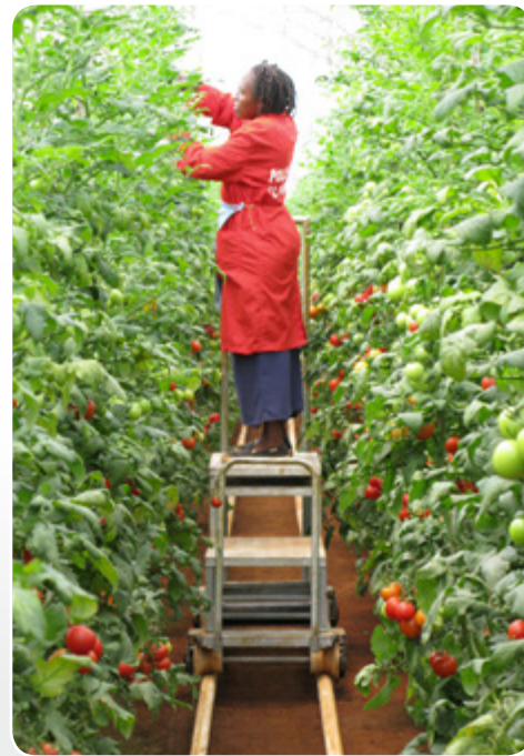
Intervention dans une serre