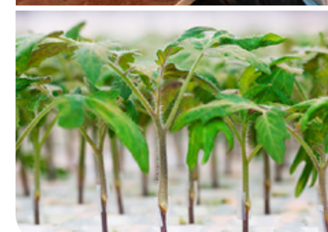
Greffage de plants de tomates