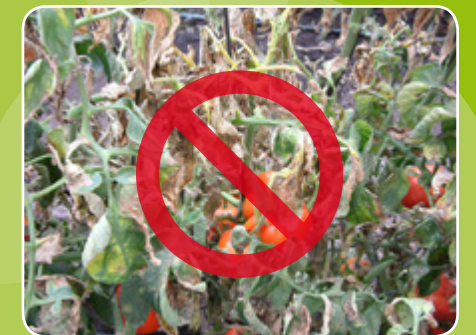
Prévenir l'apparition de Cmm avec GSPP