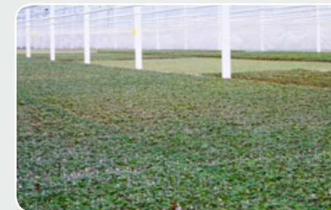
Plants de tomates chez un producteur de plants

sanitaire clair et transparent, ce qui fait partie du système qualité de notre entreprise. Depuis que nous fournissons des informations claires, nos clients savent ce que nous produisons et ce qu'ils peuvent attendre de notre entreprise : un plant accrédité GSPP !! »