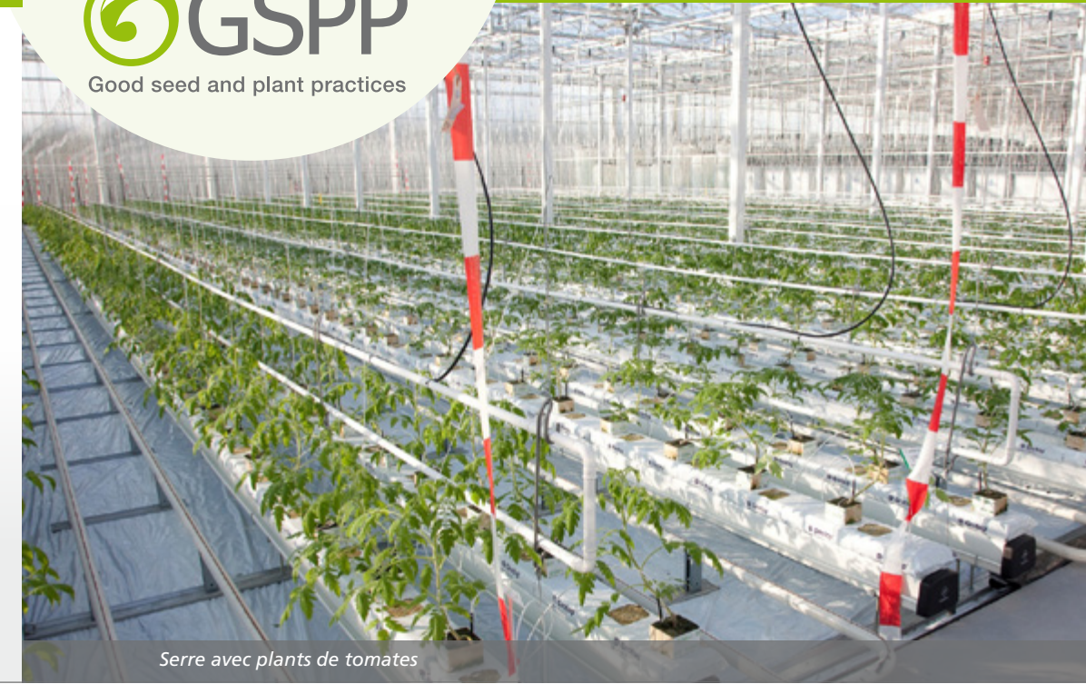
Serre avec plants de tomates

Spécialiste des Légumes et Directeur Qualité GSPP chez Vreugdenhil BV :