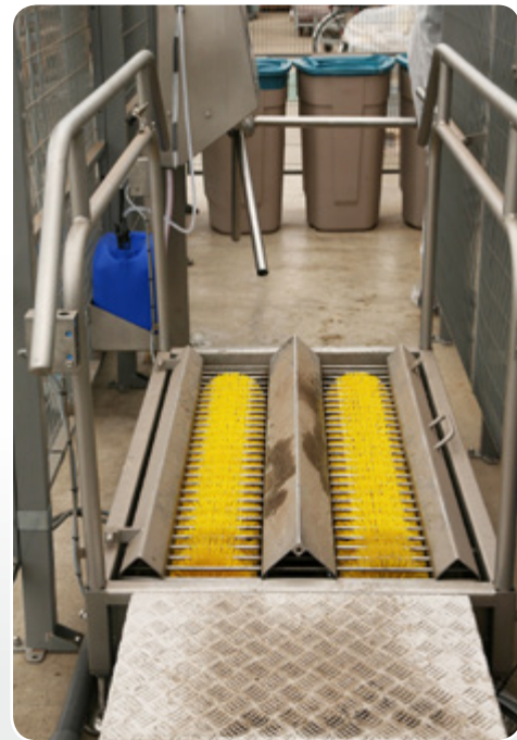
Zone de désinfection des mains et des pieds